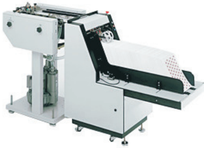
BSA 5000 mit Sauganleger SF